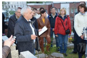
I Rajd Śladami Pamięci Powstań Śląskich w ramach Nocy Muzeów z IPN Katowice.