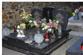
I Rajd Śladami Pamięci Powstań Śląskich w ramach Nocy Muzeów z IPN Katowice.