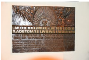
I Rajd Śladami Pamięci Powstań Śląskich w ramach Nocy Muzeów z IPN Katowice.