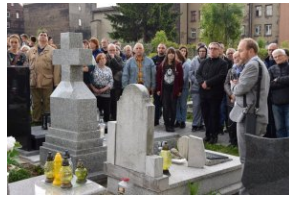
I Rajd Śladami Pamięci Powstań Śląskich w ramach Nocy Muzeów z IPN Katowice.