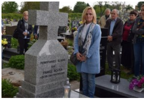
I Rajd Śladami Pamięci Powstań Śląskich w ramach Nocy Muzeów z IPN Katowice.