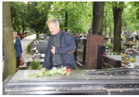
I Rajd Śladami Pamięci Powstań Śląskich w ramach Nocy Muzeów z IPN Katowice.