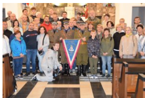
I Rajd Śladami Pamięci Powstań Śląskich w ramach Nocy Muzeów z IPN Katowice.