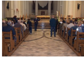
I Rajd Śladami Pamięci Powstań Śląskich w ramach Nocy Muzeów z IPN Katowice.