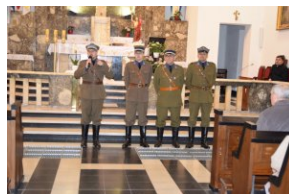
I Rajd Śladami Pamięci Powstań Śląskich w ramach Nocy Muzeów z IPN Katowice.