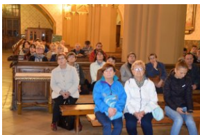
I Rajd Śladami Pamięci Powstań Śląskich w ramach Nocy Muzeów z IPN Katowice.