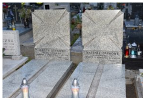
I Rajd Śladami Pamięci Powstań Śląskich w ramach Nocy Muzeów z IPN Katowice.