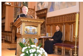
I Rajd Śladami Pamięci Powstań Śląskich w ramach Nocy Muzeów z IPN Katowice.