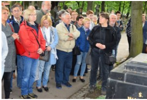
I Rajd Śladami Pamięci Powstań Śląskich w ramach Nocy Muzeów z IPN Katowice.