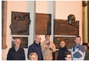
I Rajd Śladami Pamięci Powstań Śląskich w ramach Nocy Muzeów z IPN Katowice.