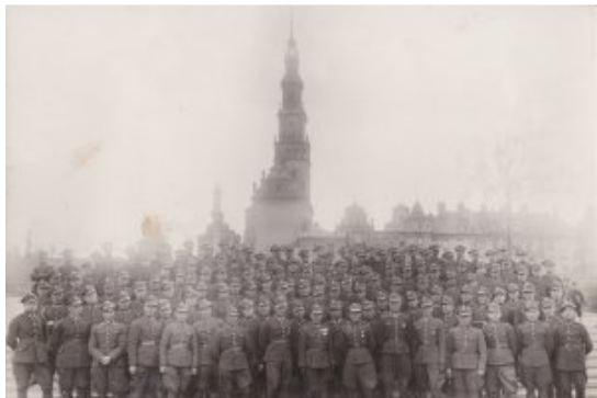
V DYW. KURS PODCHOR. REZ. 7D.P. PRZY. 27 P.P. 1936/37 R.