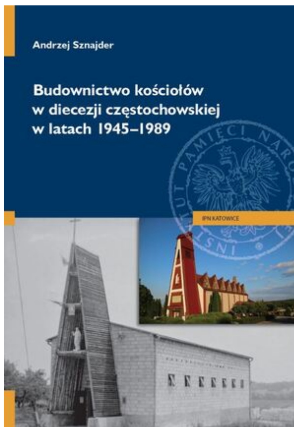
Budownictwo kościołów w diecezji częstochowskiej w latach 1945-1989.

Czwarty rozdział poświęcono polityce śląsko-zagłębiowskiej PPR wobec organizacji społecznych i zawodowych. Wszystkie zrzeszenia w większym lub mniejszym stopniu zmuszone były uznać zwierzchnictwo partii rządzącej, lecz niektóre były wprost jej emanacjami, natomiast inne, wywodzące się ze stowarzyszeń o przedwojennej genezie,