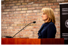
Uroczyste odsłonięcie tablicy upamiętniającej mec. Jerzego Kurcyusza - Katowice, 18 kwietnia 2024.