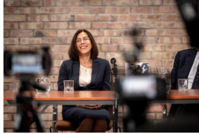
Uroczyste odsłonięcie tablicy upamiętniającej mec. Jerzego Kurcyusza - Katowice, 18 kwietnia 2024.