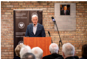
Uroczyste odsłonięcie tablicy upamiętniającej mec. Jerzego Kurcyusza - Katowice, 18 kwietnia 2024.