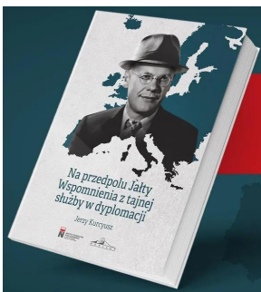
Książka Jerzego Kurcyusza „Na przedpolu Jajty. Wspomnienia z tajnej służby w dyplomacji”.