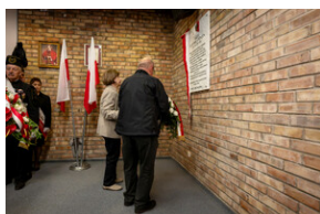
Uroczyste odsłonięcie tablicy upamiętniającej