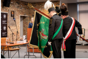
Uroczyste odsłonięcie tablicy upamiętniającej mec. Jerzego Kurcyusza - Katowice, 18 kwietnia 2024.