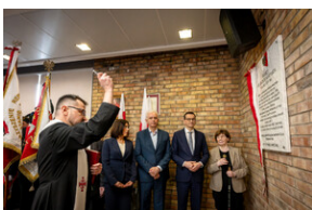
Uroczyste odsłonięcie tablicy upamiętniającej