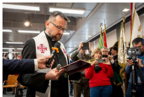
Uroczyste odsłonięcie tablicy upamiętniającej mec. Jerzego Kurcyusza - Katowice, 18 kwietnia 2024.