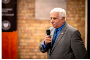
Uroczyste odsłonięcie tablicy upamiętniającej mec. Jerzego Kurcyusza - Katowice, 18 kwietnia 2024.