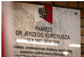
Uroczyste odsłonięcie tablicy upamiętniającej mec. Jerzego Kurcyusza - Katowice, 18 kwietnia 2024.