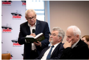
Uroczyste odsłonięcie tablicy upamiętniającej mec. Jerzego Kurcyusza - Katowice, 18 kwietnia 2024.