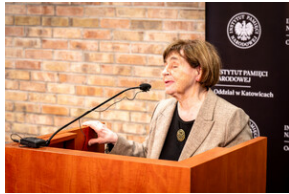
Uroczyste odsłonięcie tablicy upamiętniającej mec. Jerzego Kurcyusza - Katowice, 18 kwietnia 2024.