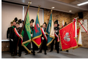
Uroczyste odsłonięcie tablicy upamiętniającej mec. Jerzego Kurcyusza - Katowice, 18 kwietnia 2024.